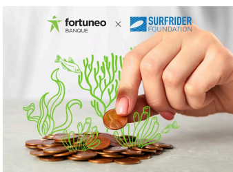
Fortuneo reverse 1 centime à Surfrider Foundation