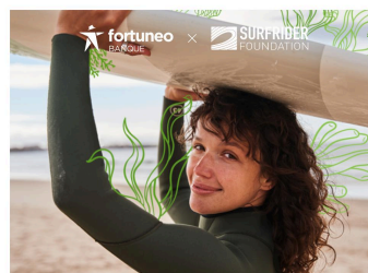
Les dons serviront à soutenir les initiatives Océanes programme emblématique de l'association